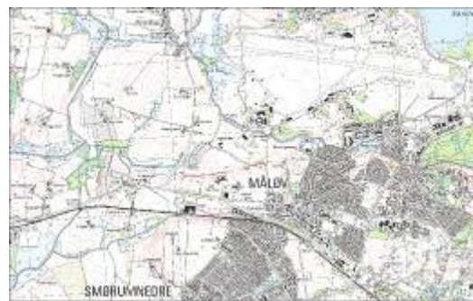
Oversigtskort. En "rude" svarer til 1x1 km.

Muldtykkelsen var generelt ringe, mellem 25 og 35 cm. Mod vest, på skrånningen ved vådområdet var der et tykkere muldlag.