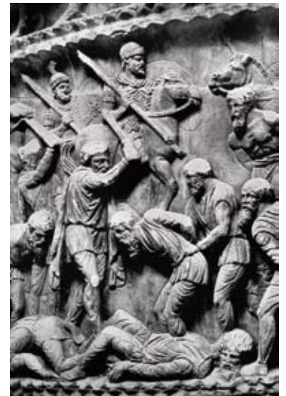
Tilfangetagne germanere afbilledet på Marcus Aurelius' triumfsøjle i Rom. Søjlen er rejst mellem år 180 og 193 e.Kr. og viser scener fra Markomanner-krigene, som foregik under kejser Marcus Aurelius.

I forbindelse med stilemnerne kan du få information og viden om jernalderen og Romerriget, når du læser bøgerne på vores litteraturliste og går på opdagelse på de nævnte hjemmesider.