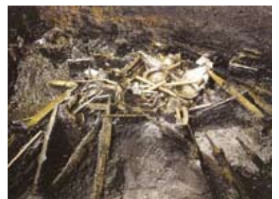
Ofrede våben fra Nydam Mose.

De talrige ofringer, som vi finder i moser og andre vådområder, var gaver til guderne. Hvorfor ofrede jernalderfolket ting og sager – ja endda mennesker?