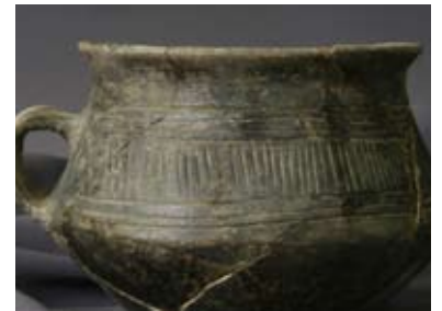
Lerkar med præget mønster

Kontakten til Romerriget var ikke kun præget af krige. Der blev også handlet med både dagligdags- og luksusvarer.