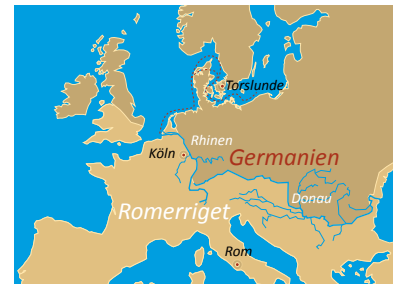
Romerriget i starten af det 3. årh. e.Kr. Handelsruten mellem Rhinmundingen og Østsjælland er markeret. Romerriget var datidens absolutte supermagt, og selvom Danmark aldrig blev en del af det romerske imperium, så var handlen med romerske luksusvarer af stor betydning.

Der foregik en livlig handel med forskellige varer mellem romere og germanere. Hvordan foregik det? Hvilke handelsruter var der? Rejste man ud med skib, med vogn, eller tog man hele den lange vej på hesteryg? Hvad blev der handlet med? Havde man penge i jernalderen?