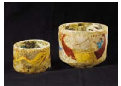
Såkaldte "circusbægre" fra fyrstegraven